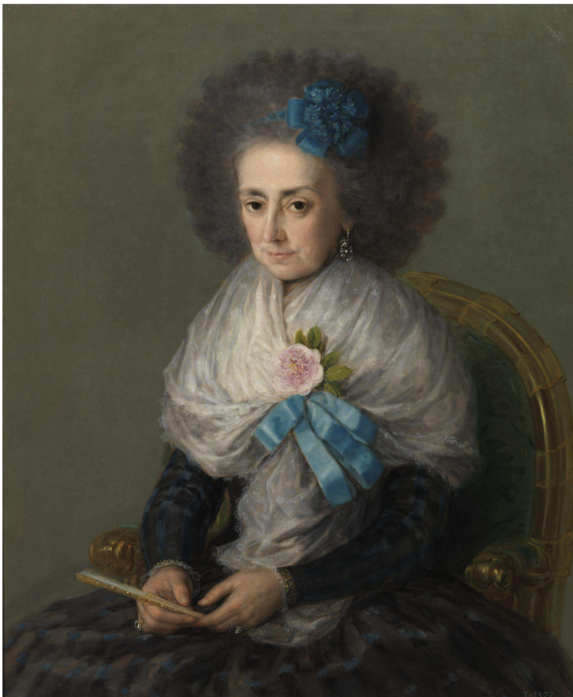
FOTO 1: María Antonia Gonzaga y Caracciolo (por Goya). (Marquesa viuda de Villafranca del Bierzo)