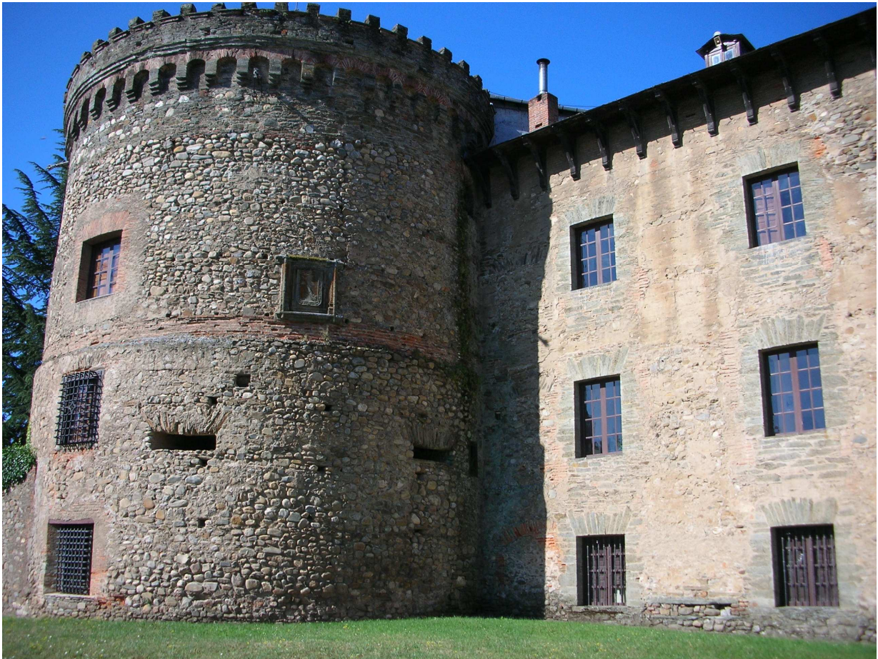
FOTO 6: Cubo de la casa-palacio del marqués de Villafranca. (Foto del autor).

[ca. 1802, diciembre]. Villafranca. (D) (BUSCARLO EN EL AFCMS)