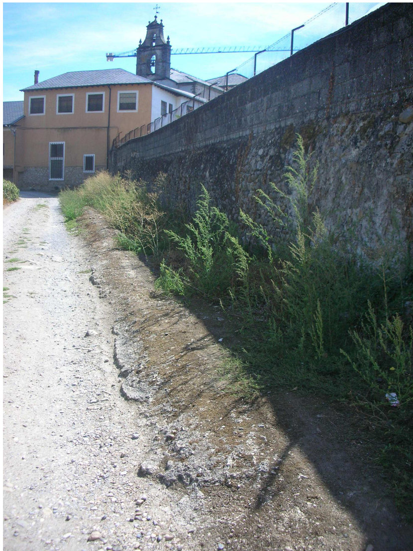
FOTO 7. Tramo oculto del arroyo de Barburiña (Villafranca).