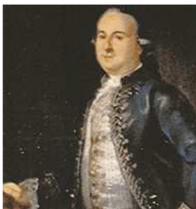
Pedro López de Lerena, retratado en 1790 por Vicente López Portaña.

Villafranca del Vierzo, 12 de Febrero de 1787.