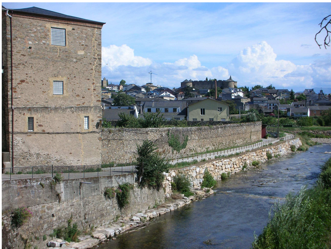
FOTO 8: Convento de la Purísima Concepción de Villafranca del Bierzo. Paredón sobre el río Valcarce. (Foto del autor).

1806, enero, 7. Villafranca. (BUSCARLO EN EL AFCMS)