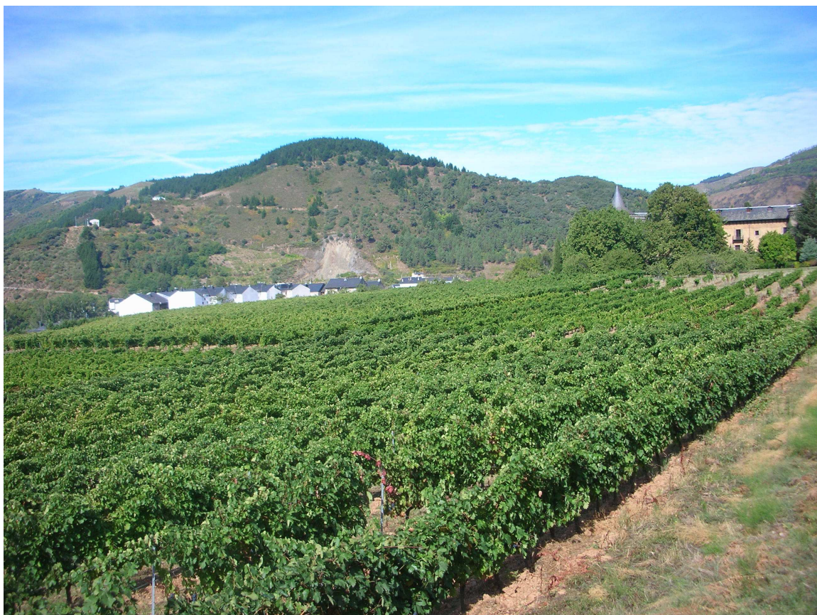
FOTO 3: Vista parcial de la viña del Jardín de la casa-palacio del marqués de Villafranca.