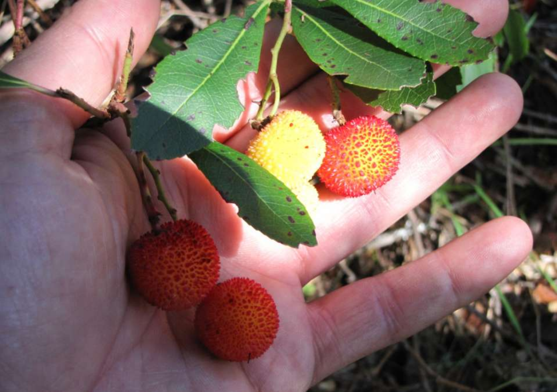
Fotografías de: Ramiro López Medrano, Carmen Arias Ferrero, Carlos Elías Rego y Nicasio Yebra Flórez Montaje: Francisco Arias Ferrero. Sección de Naturaleza y Senderismo del INSTITUTO DE ESTUDIOS BERCIANOS